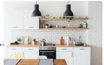
ダイニングキッチン