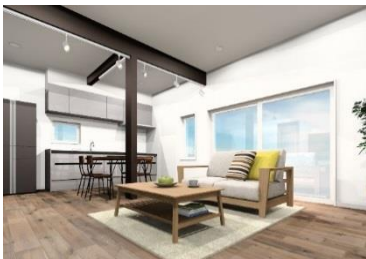
リビングスペース

和紙たみ床の落ち着いた寝室。続き間のウォークインクローゼットで収納力も充分です。